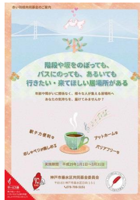
▲ 『募金呼びかけのチラシ』