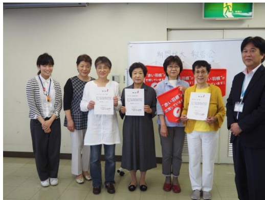
▲ 『助成先の居場所関係者さまと』