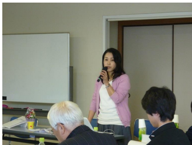
▲プレゼンテーションの様子

公開審査会では、書類審査を通過した 7 団体(一次募集)と 4 団体(二次募集)が審査員に向けプレゼンテーションを行い、質疑に応答しました。審査員は発表内容等をもとに、各申請事業を 9 つの評価項目(各項目につき 6 点、合計 54 点)で採点し、申請事業(団体)の順位づけを行いました。尚、上記手続きはすべてを同日に、公開の場で実施しました。